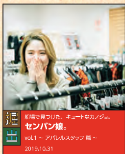
知出 船場で見つけた、キュートなカノジョ。 センバン娘。 vol.1 ~ アパレルスタッフ 篇 ~ 2019.10.31