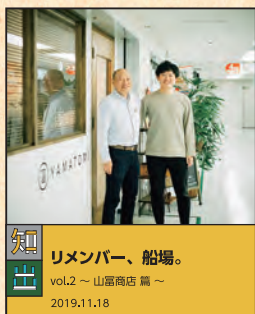
知出 リメンバー、船場。 vol.2 ~ 山富商店 篇 ~ 2019.11.18