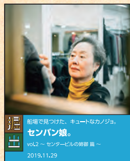
知出 船場で見つけた、キュートなカノジョ。 センバン娘。 vol.2 ~ センタービルの時節 篇 ~ 2019.11.29