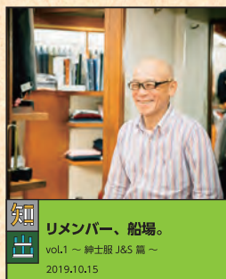
知出 リメンバー、船場。 vol.1 ~ 紳士服 J&S 篇 ~ 2019.10.15