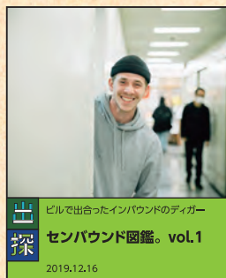
知探 ビルで出会ったインバウンドのディガー センバウンド図鑑。vol.1 2019.12.16