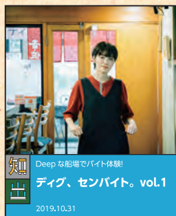
知出 Deepな船場でバイト体験! ディグ、センバイト。vol.1 2019.10.31