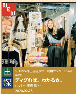
知探 SPINNS 梅田店店長が、船場センタービルを訪ね ディグれば、わかるさ。 vol.4 ~ 販売 篇 ~ 2020.02.28